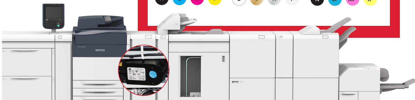
Presse Xerox® Versant® 280 – Option Package Performance