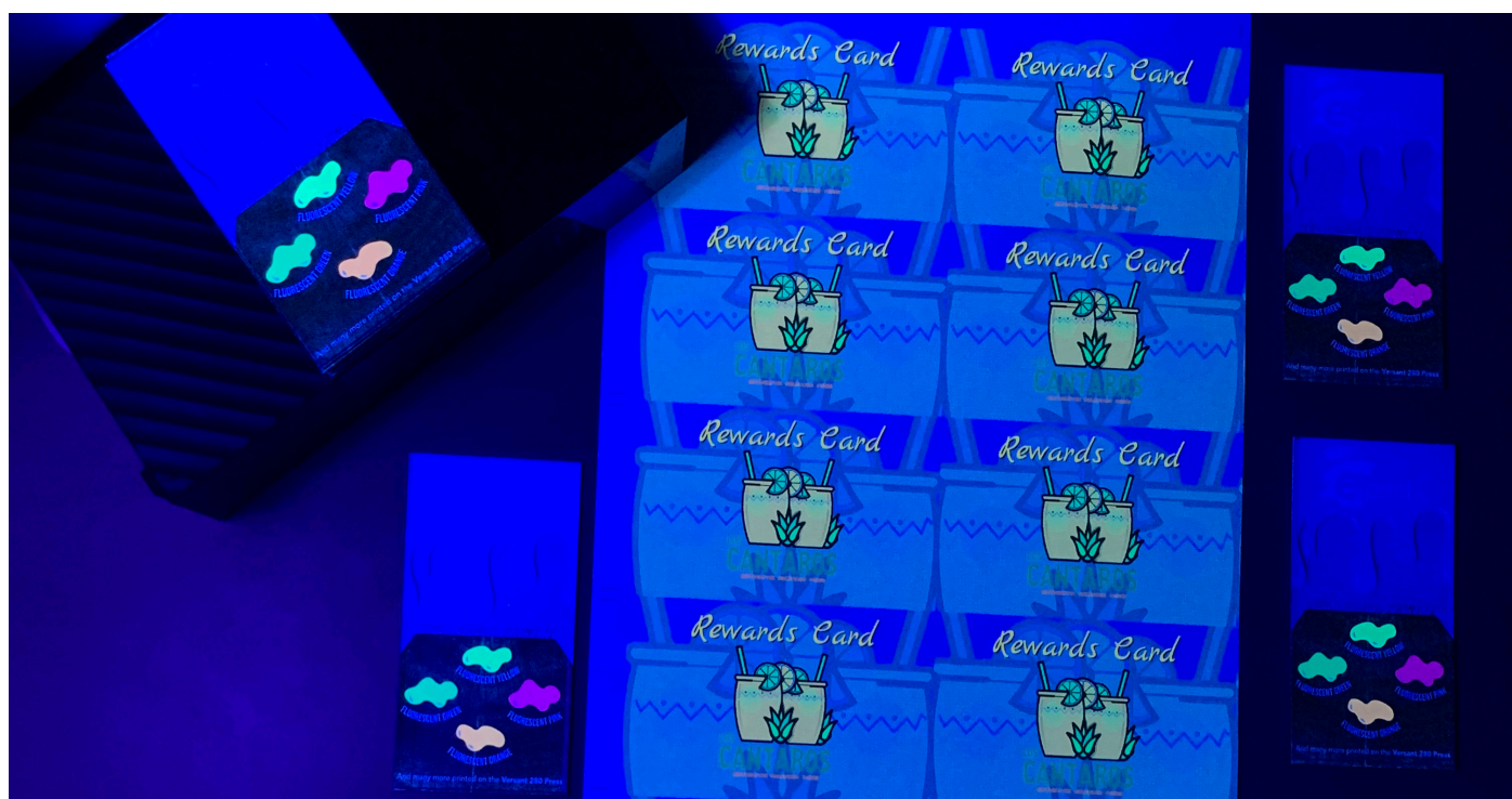
Le toner fluorescent brille d'une véritable fluorescence sous une lumière noire.