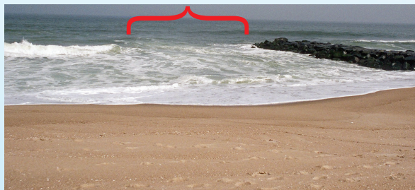
Con frecuencia la corriente marina se origina cerca de estructuras costeras.