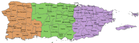
Regiones de CoCoRaHS de Puerto Rico Puerto Rico CoCoRaHS Regions Central Central Este East Oeste West