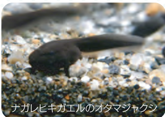
ナガレヒキガエルのオタマジャクシ

子どもの頃、捕まったり家で飼ったりしたオタマジャクシ。すごく身近な生き物ですよ。でも、意外にもオタマジャクシの生態は奥が深く、知られていないことがたくさんあります。