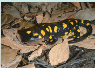
7月 ファイヤーサラマンダー