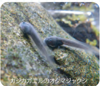
カジカガエルのオタマジャクシ

たとえば、口が吸盤状になっているオタマジャクシ、これは岐阜県に生息するカエルの中ではカジカガエルとナガレヒキガエルで見られますが、この2種は川の上流の流れの速いところで育つため、流されないように吸盤状の口で岩などにくっついて生活しています。変態せず1年以上もオタマジャクシのままのオタマ