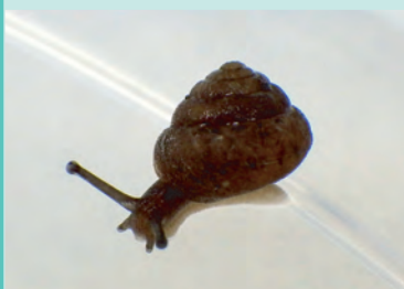
6月 カタマメマイマイ