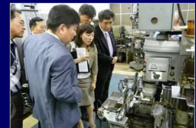
国内外の工場見学ツアー