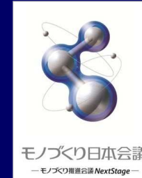
モノづくり日本会議