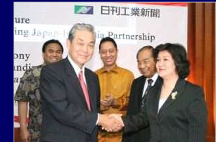
海外ネットワーク (インドネシア、韓国、中国ほか) による各種支援サービス