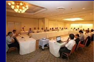
グリーンフォーラム