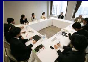
キャンパスベンチャーグランプリ受賞者 (※若手起業家) ネットワーク