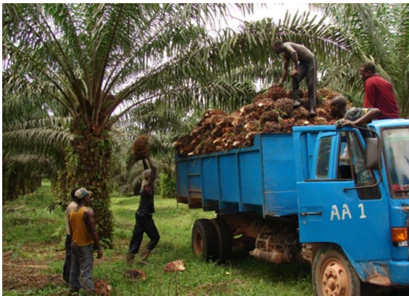
Récolte des régimes de palme

Le programme forêt et environnement : contribuer à la sauvegarde du patrimoine forestier et à l'amélioration des productions forestières et agricoles de la Côte d'Ivoire. Améliorer la production des ressources forestières et agro-forestières, valoriser les ressources forestières et agroforestières.