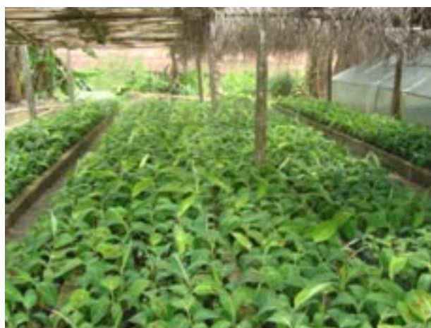
Pépinières de bananier