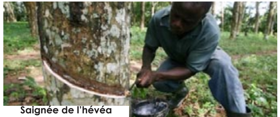
Saignée de l'hévéa

Abidjan est constituée d'une végétation dense et bien fournie.