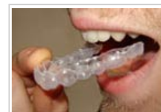
Les produits de blanchiment des dents peuvent s'appliquer au moyen de gouttières sur mesure

Les personnes présentant certaines maladies génétiques sont plus vulnérables au peroxyde d'hydrogène parce que leur organisme n'est pas capable de le décomposer efficacement.