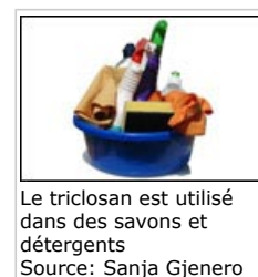
Le triclosan est utilisé dans des savons et détergents

2.1 Dans les cosmétiques , le triclosan sert d'agent de conservation. Il est également utilisé dans les savons, les déodorants et les dentifrices (pour contrôler la plaque dentaire et améliorer la santé des gencives).