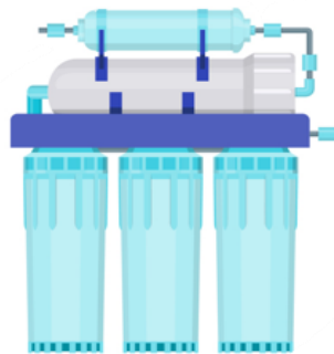
Bajo el Fregadero

Ejemplos de cómo son los diferentes modelos de filtros: