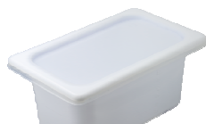
業務用 2L / 4L パック