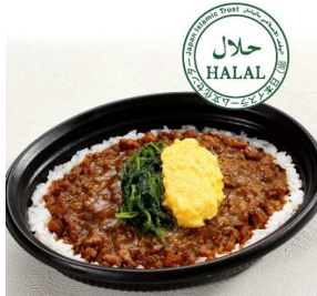
スパイシーチキンライス