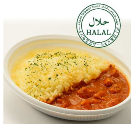
バターチキンカレー