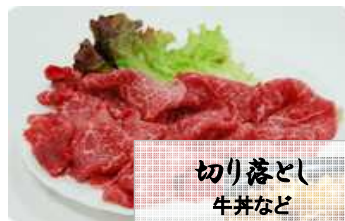
切り落とし 牛丼など