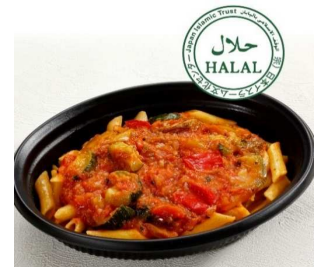
ベジタブルペンネ