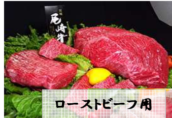
ローストビーフ用