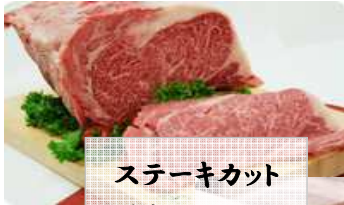
ステーキカット ヒレ・ロース