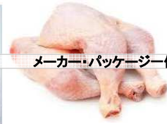
メーカー・パッケージ例