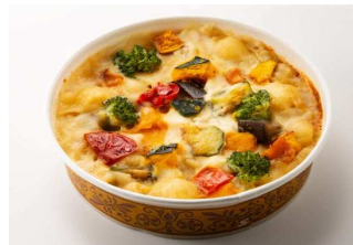
野菜のクリームパスタ