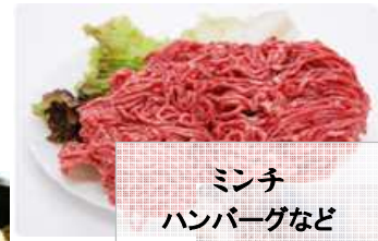
ミンチ ハンバーグなど