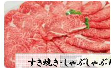
すき焼き・しゃぶしゃぶ用