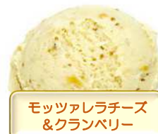
モッツァレラチーズ & クランベリー