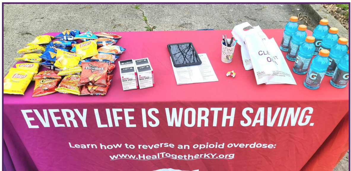
Abajo: Mesa de acercamiento de la OEND con bebidas y papas fritas de regalo.