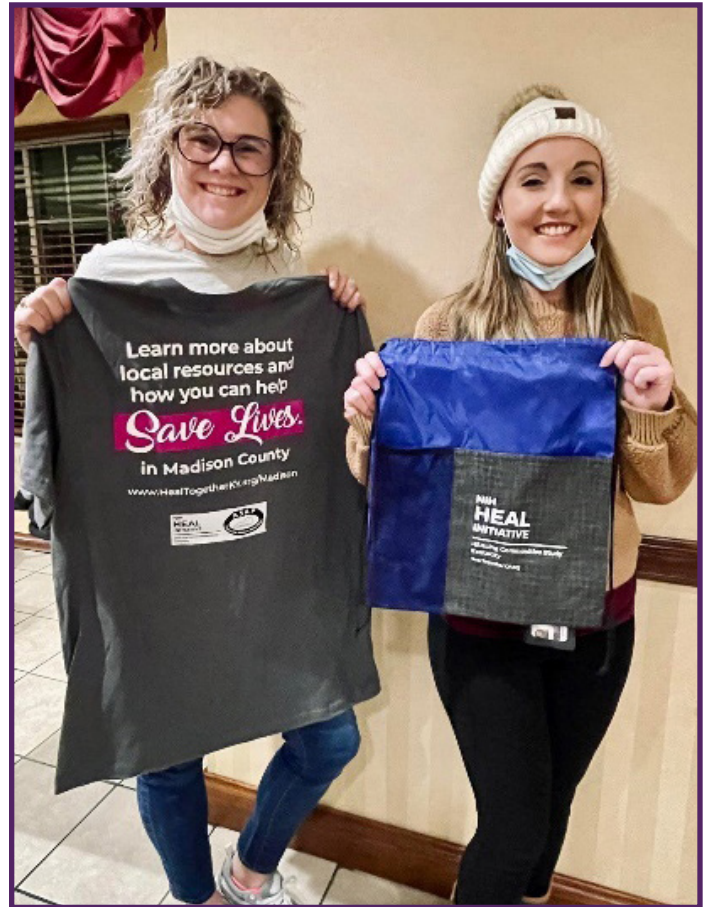
Arriba: Asociada comunitaria y especialista en prevención muestran camisetas y bolsas con cordón para regalar.