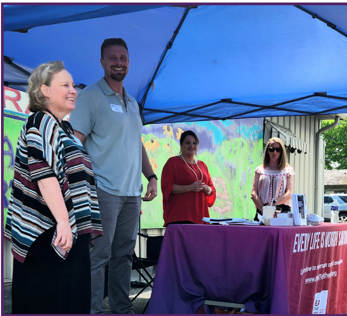
OEND temporaria al aire libre en el condado de Bourbon (arriba) y en el condado de Carter (abajo), Kentucky.

un evento temporal cerca de una oficina principal en un complejo de viviendas o un estacionamiento para casas rodantes, en general, suele ser mejor pensar el día del evento cuando se deba pagar el alquiler. Algunos negocios tienen perfil en Google, y puede usarlos para determinar el mejor momento del día buscando el negocio, haciendo clic en el perfil de Google y analizando el gráfico que muestra los horarios de mayor concurrencia de personas cada día de la semana.