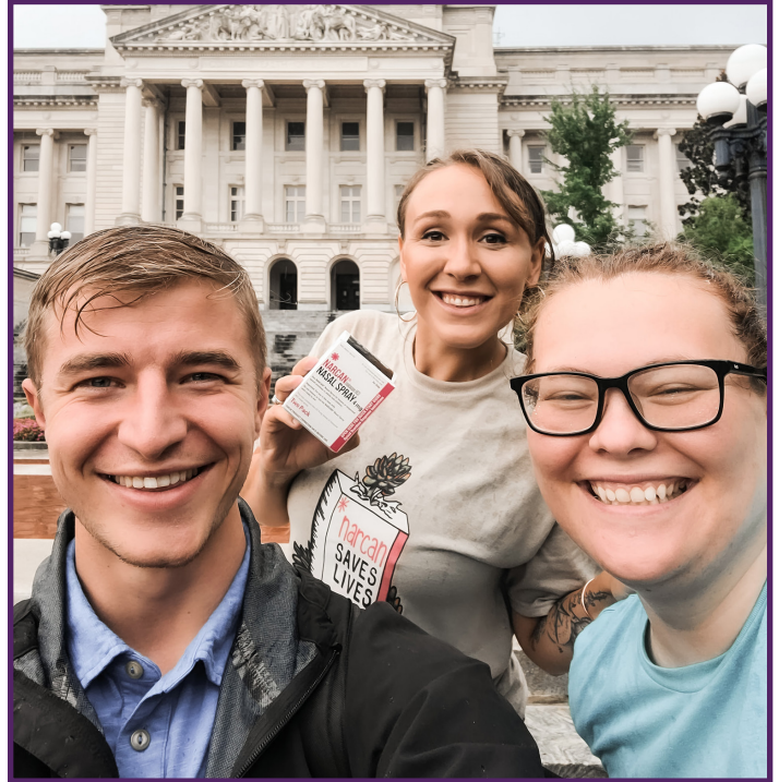
Personal de HCS-KY en el Capitolio de los Estados Unidos durante el Día de la Concienciación sobre la Sobredosis en el condado de Franklin, Kentucky

Al considerar a los candidatos para especialistas en prevención, HCS-KY tuvo éxito contratando a personas que tuvieran experiencia con el trastorno por consumo de sustancias (SUD). Esta experiencia podía ser la propia experiencia personal de la persona, la experiencia de un ser querido o la experiencia profesional por haber trabajado con personas diagnosticadas con SUD. Gracias a esta experiencia vivida, los especialistas en prevención pueden conectarse con los miembros de la comunidad a un nivel más personal. También es más probable que los reciban en entornos como las reuniones de apoyo (p. ej., AA, NA), las residencias de recuperación y los centros de tratamiento.