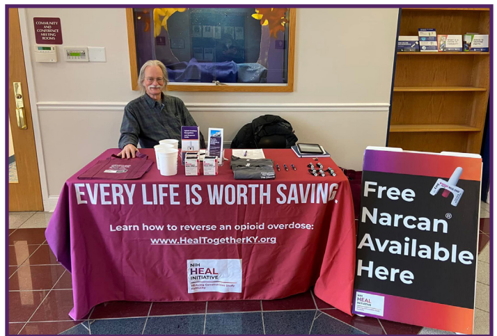
Acercamiento de la OEND en bibliotecas públicas en el condado de Kenton (arriba) y en el condado de Clark (abajo), Kentucky.