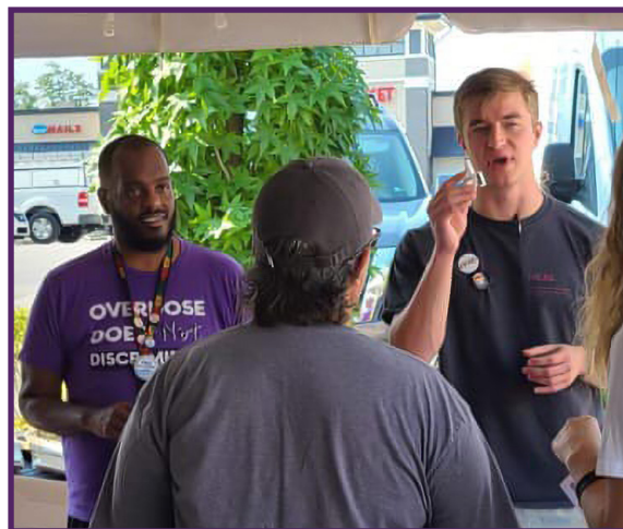
Izquierda: Acercamiento de la OEND en una agencia de apoyo a la recuperación en el condado de Boyle, Kentucky.