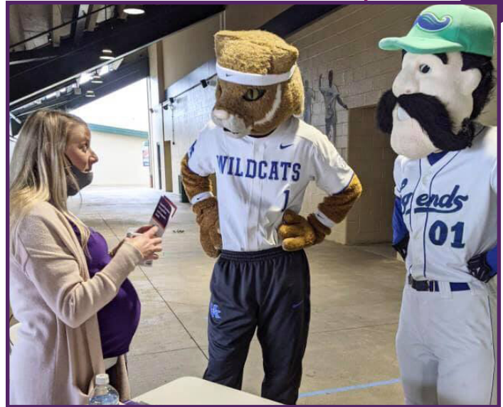
Personal de HCS-KY capacitando a miembros clave de la comunidad en un evento local de compras en el condado de Fayette, Kentucky.