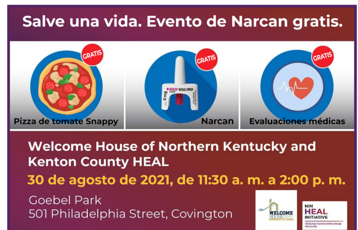
Gráfico de ejemplo en redes sociales para un evento recurrente de OEND (arriba) y un acercamiento de la OEND con una agencia asociada (abajo).