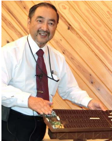
Model van Noag se Ark