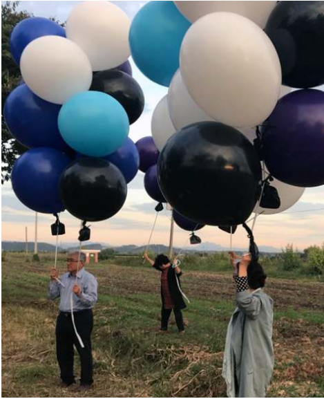
Ballonne opgestuur na Noord Korea

gevang en teruggestuur sal word. Reddingswerkers bied onmiddellike bystand aan sulke vlugtelinge.