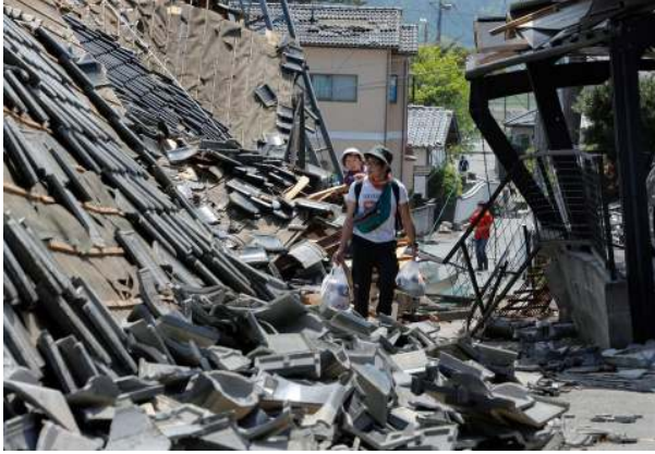
Aardbewingskade in Kumamoto

Nog 'n kragtige 7.0-aardbewing het die stad, Kumamoto, in die suidweste van Japan op 16 April 2016 getref. Dit het 140 naskokke binne twee dae veroorsaak. Vyftig mense is dood, 3 000 is beseer, 44 000 is ontruim en 180 000 huise is beskadig. 26 000 weermagreserwes is ontplooi.