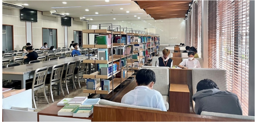
Sinh viên tự học tại thư viện trường Y Dược TP HCM.

Trong 5 năm qua (2016-2021), IMPACT-MED đã hỗ trợ 5 trường Đại học Y Dược, bao gồm: Y Dược Thành phố Hồ Chí Minh (TP.HCM), Y Dược Huế, Y Dược Thái Nguyên, Y Dược Thái Bình và Y Dược Hải Phòng để cải cách chương trình giáo dục y khoa, đổi mới thực hành và thiết chế quản trị, đồng thời tăng cường công tác đảm bảo chất lượng bên trong nhằm cải tiến liên tục.