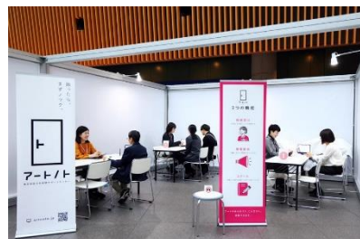
アートノト出張相談コーナー(イメージ)

※「ART JOB FAIR 2025」への入場には事前申込が必要です。詳細は ウェブサイト をご覧ください。