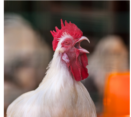
DIFICULTAD PARA RESPIRAR, TOS, O ESTORNUDOS