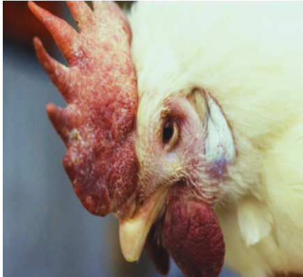
HINCHAZÓN DE LA CRESTA, BARBILLAS Y PÁRPADOS .