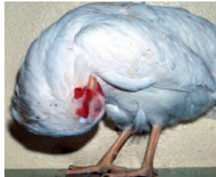
TORSIÓN DE LA CABEZA Y EL CUELLO (TORTÍCOLIS)