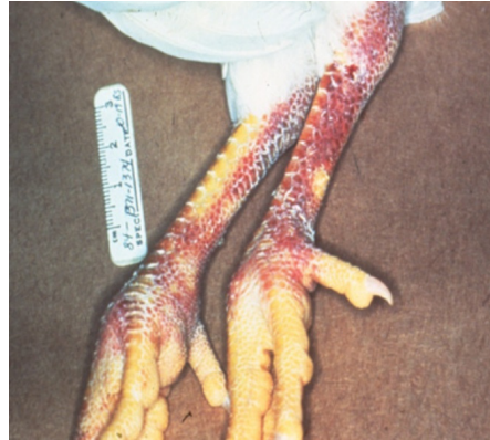
DECOLORACIÓN PÚRPURA DE LAS BARBILLAS, CRESTA Y LAS PATAS