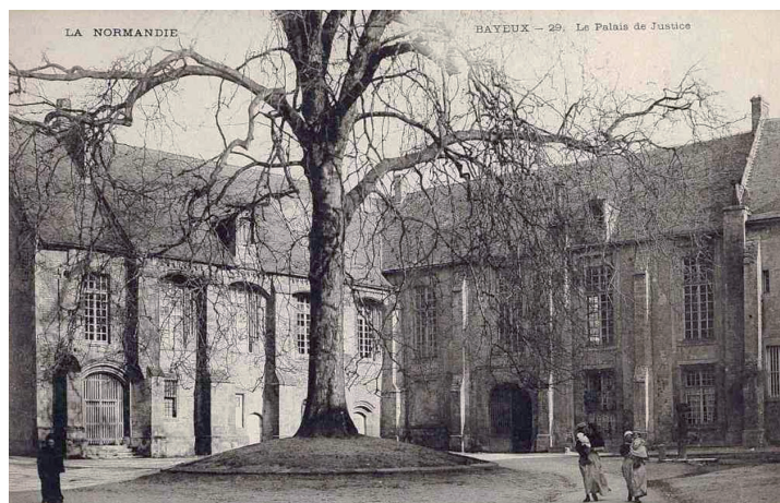
Le palais de justice et l'arbre de la Liberté au début du XX e siècle

de France. En 1932, il est classé parmi les sites comme monument naturel remarquable. En octobre 2000, il obtient le label « arbre remarquable de France ».