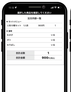
4 選択内容や合計金額を確認後、受取希望時間を選択