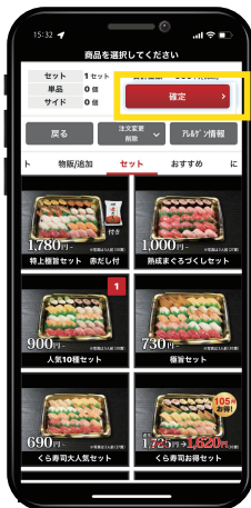
3 一覧画面に戻り、確定を選択