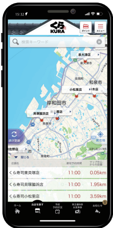
お受取の店舗を選択し、お持ち帰り注文を選択