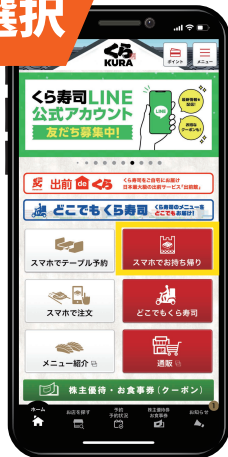
スマホ内の「スマホでお持ち帰り」を選択