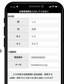
5 お客様情報の入力確認後、「支払い方法」を選択