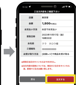
6 最終確認の上、注文を確定!

お持ち帰り注文確定後のキャンセルや変更は、受付店舗へ直接お電話でお問い合わせください。