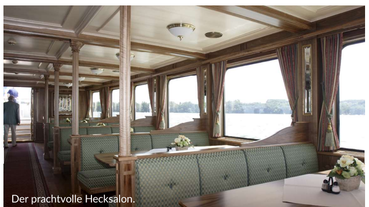
Der prachtvolle Hecksalon.