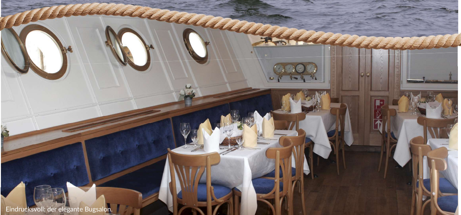
Eindrucksvoll: der elegante Bugsalon.