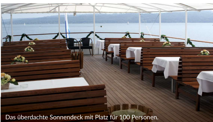
Das überdachte Sonnendeck mit Platz für 100 Personen.