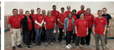
4. Ayuda en desastres

Descubra nuestra colaboración con el Ministerio de Justicia del Reino Unido