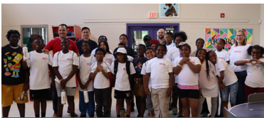
1. Educación y capacitación del personal

NOS CENTRAMOS EN CUATRO ÁREAS ESTRATÉGICAS DE INVERSIÓN Y ACTIVIDADES FILANTRÓPICAS: