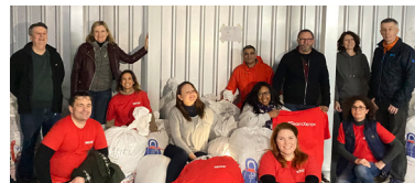
2. Comunidades fuertes y dinámicas